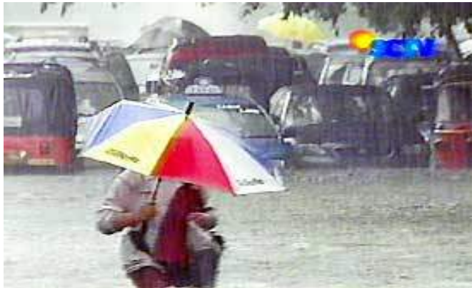
Gambar 4 Akibat banjir di Jakarta

Secara umum banjir dan tanah longsor yang biasa terjadi di Indonesia dalam musim hujan disebabkan oleh penebangan hutan ilegal dan pembukaan lahan pertanian. Pada akhir-akhir ini luas hutan alam asli Indonesia menyusut dengan kecepatan yang sangat mengkhawatirkan. Hingga saat ini, Indonesia telah kehilangan hutan aslinya sebesar 72 persen [ World Resource Institute, 1997 ]. Penebangan hutan Indonesia yang tidak terkendali selama puluhan tahun menyebabkan terjadinya penyusutan hutan tropis secara besar-besaran. Laju kerusakan hutan periode 1985-1997 tercatat 1,6 juta hektar per tahun, sedangkan pada periode 1997-2000 menjadi 3,8 juta hektar per tahun. Ini menjadikan Indonesia merupakan salah satu tempat dengan tingkat kerusakan hutan tertinggi di dunia. Di Indonesia berdasarkan hasil penafsiran citra landsat tahun 2000 terdapat 101,73 juta hektar hutan dan lahan rusak, di antaranya seluas 59,62 juta hektar berada dalam kawasan hutan [ Badan Planologi Dephut, 2003 ].