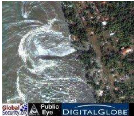
Gambar 2 Tsunami di Srilanka

tidak akan lebih besar dari tsunami yang datang pertama. Dari posisi sumber gempa pertama (8.9R), kedatangan gelombang tsunami di wilayah pesisir barat Sumatra akan cenderung membentuk gelombang tepi ( edge wave ). Gelombang tsunami jenis ini bergerak sejajar atau paralel dengan garis pantai, meski sifatnya juga merusak, tetapi kerusakan akan lebih parah terjadi bila kedatangan gelombang tsunami cenderung tegak lurus ke arah pantai. Meski demikian wilayah NAD mengalami kerusakan terparah dengan korban terbanyak dibanding kerusakan dan korban di negara lain, karena lokasinya yang relatif dekat dari sumber asal tsunami. 22