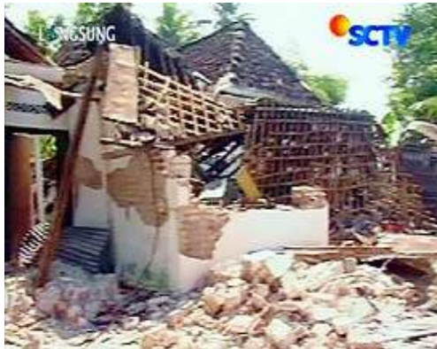
Gambar 3 Pasca gempa di Yogya